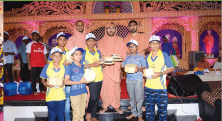
શ્રી સ્વામિનારાયણ મંદિર ભુજ સંચાલિત શ્રી ઘનશ્યામ બાલમંડળનો દ્વાદશાબ્દી બાલમંચ