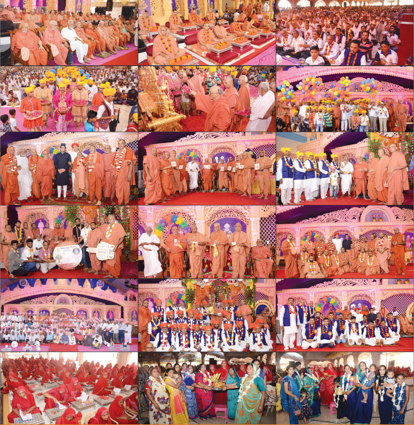
સર્વમંગલ સ્મૃતિ મહોત્સવ અંતર્ગત સર્વમંગલ મેડીકલ કેમ્પ-૨૦૧૮