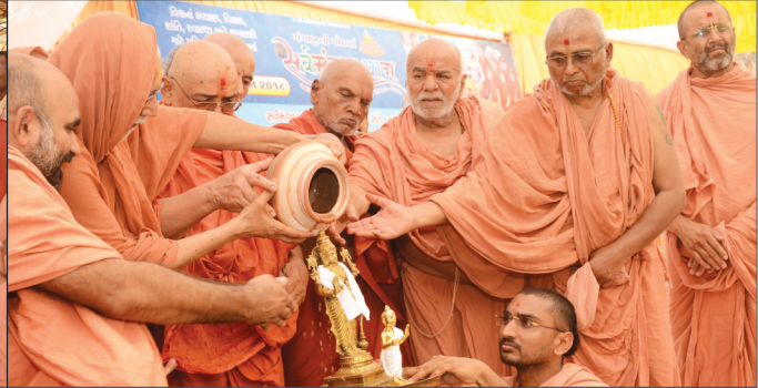
અધિક માસ દરમ્યાન ઉજવાયેલ શ્રી સર્વમંગલયાગ પૂર્ણાહુતિ પ્રસંગે પૂ. મહંત સ્વામી આદિ સંતો, રામપર - વેકરા (ગંગાજી)