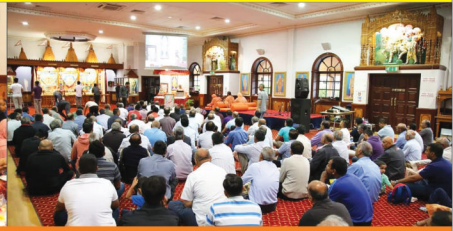
કેન્ટન હેરો યુ.કે.માં અધિકમાસ નિમિત્તે મહાપૂજા તથા કથા પારાયણ