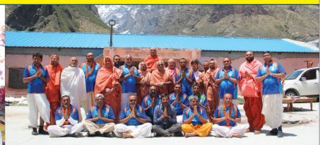
શ્રી ક.સ. સ્વામિનારાયણ મંદિર લંગાટાના હરિભક્તોના યજમાન પટે શ્રી બદ્રિનાથ ક્ષેત્રમાં શ્રીહરિયાગ