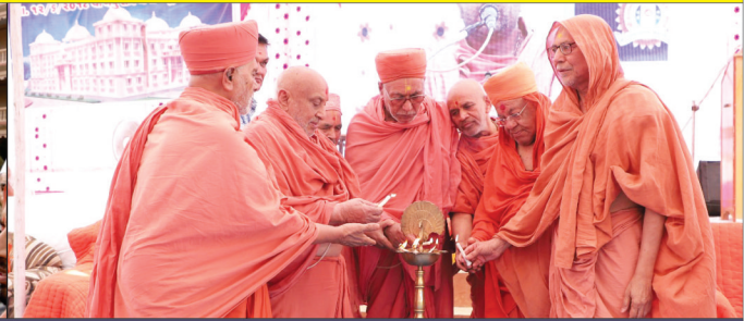
શાળા પ્રવેશોત્સવ - શ્રી સહજાનંદ ગુરુકુળ, માનકુવા