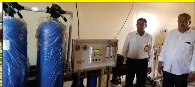
નારણપર શ્રી સ્વામિનારાયણ ગુરુકુલમાં આરોપ્તાન મશીન અર્પણ કરતા સ્વજીભાઈ